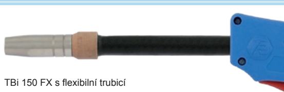
TBi 150 FX s flexibilní trubicí